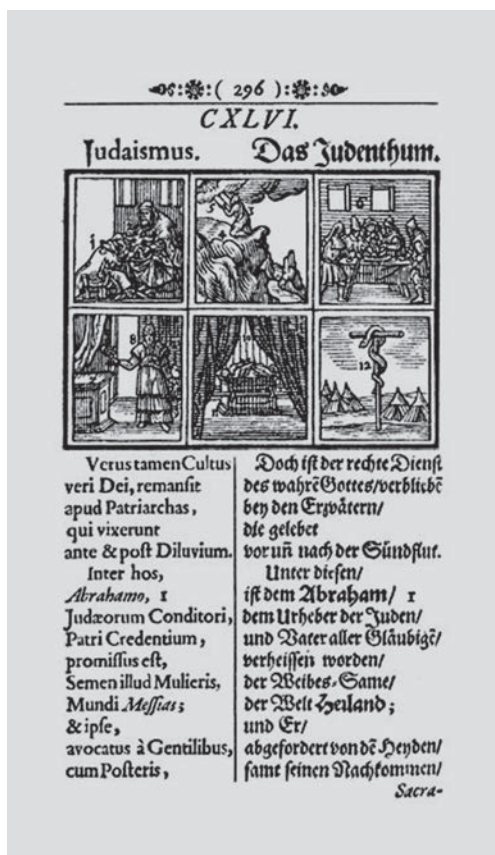
Z Komenského knihy Orbis pictus (Svět v obrazech).

Než ocituji Komenského poselství, s nímž se obracel na tehdejší lidstvo a které je z výše uvedených důvodů aktuální i pro nás, musím dodat několik slov na vysvětlenou. Svůj projekt reformy vzdělanosti a vědění, náboženství a politiky, který předložil především v Obecné poradě o nápravě věcí lidských (ale i ve spisu Via lucis – Cesta světla ), nepovažoval za nějakou idealistickou vizi, nýbrž charakterizoval ho jako plod celých dosavadních dějin ( fructus historiae ). Komenský přesvědčuje své současníky, že tok dosavadních lidských dějin (jestliže jej náležitě analyzujeme) nejen připravil, ale i naléhavě vyžaduje provedení oné fundamentální reformy, již celé dosavadní lidské dějiny vyvrcholí, čímž se otevře cesta k příchodu království Božího již na Zemi. Komenský nazývá svůj program fundamentální emendace lidských věcí „poslední reformací“, ke které jsme všichni povoláni a jež konečně vytvoří pravou katolicitu, čímž samozřejmě myslí nové, bratrské a kreativní lidské společenství. Konkrétně to pro něho znamená, že v budoucnosti již nebudeme jen Francouzi, Rakušany, Španěly aj., ale „dobrymi politiky“,